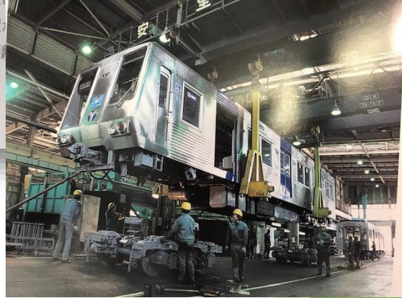
かかえながらも、震災の焼け 並茂吉が第一に考えたのは、 実際に横浜駅は駅舎の距離 向いていない駅 涼から30分の距離

展示期間：平成29年7月28日(金)～平成29年10月20日(金) 展示場所：学術情報センター南棟1階